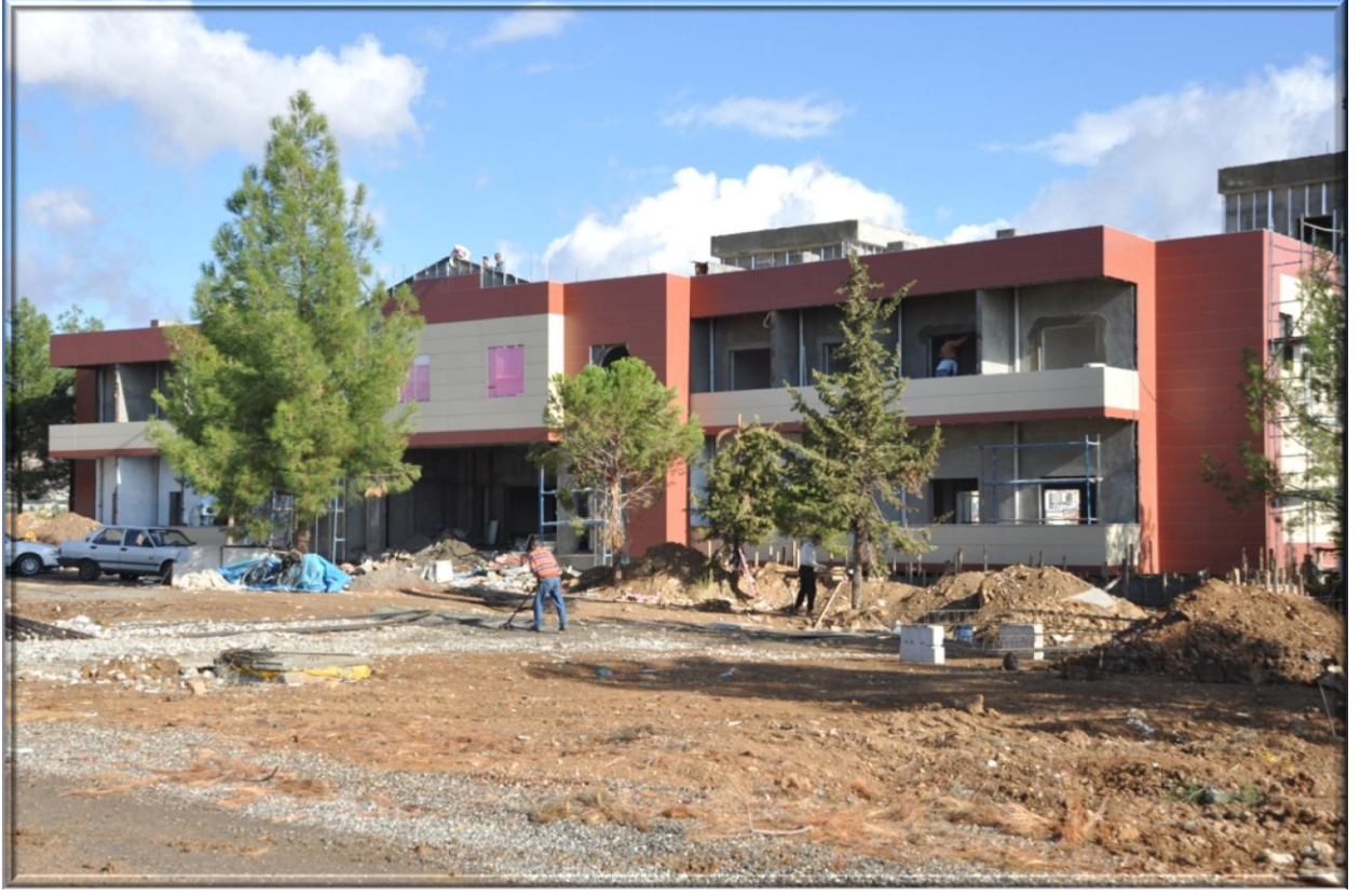
Meslek Yüksekokulu Uygulama Oteli