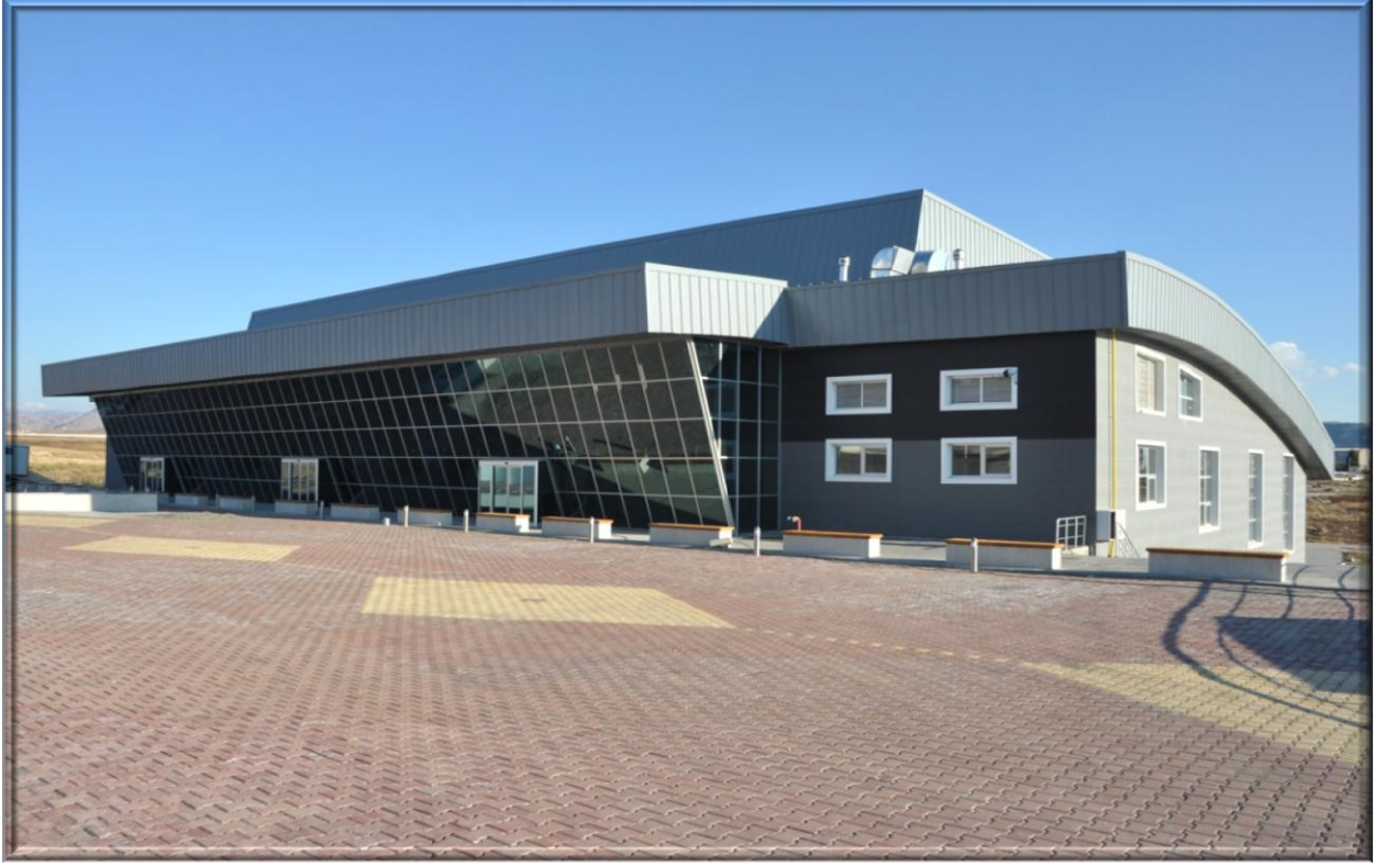
Kapalı Spor Salonu