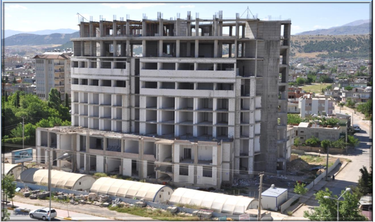
Tıp Fakültesi Hastanesi (2. Etap)

İkinci etabın inşaat çalışmaları devam etmektedir.