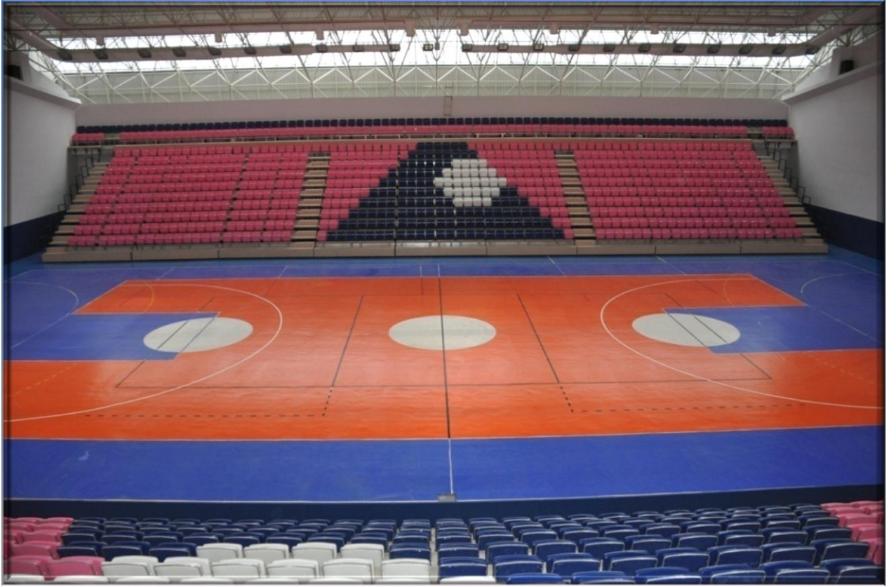
Kapalı Spor Salonu