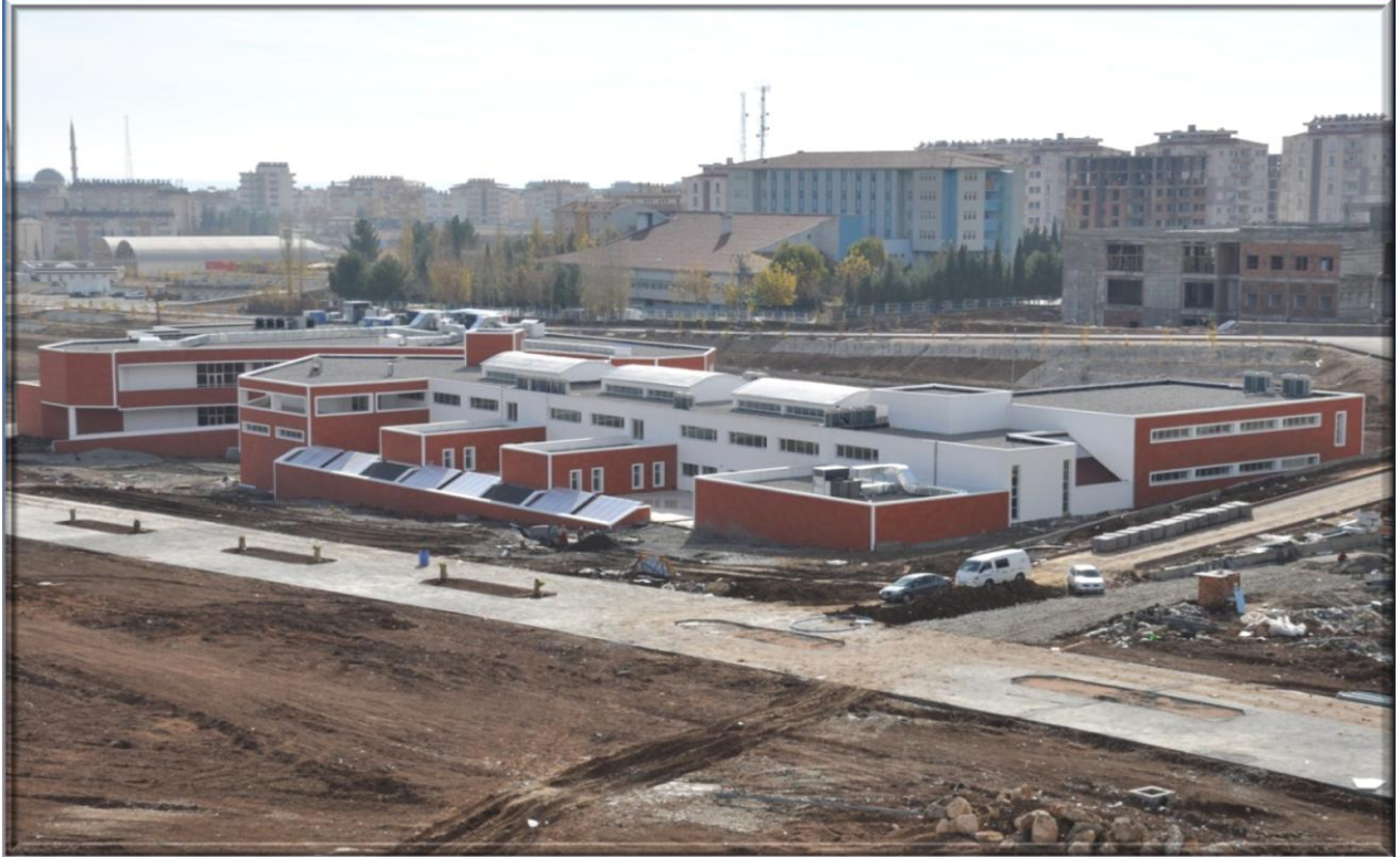
Mediko Sosyal Binası

Bu proje kapsamında yapılan Mediko Sosyal Binası tamamlanmıştır.