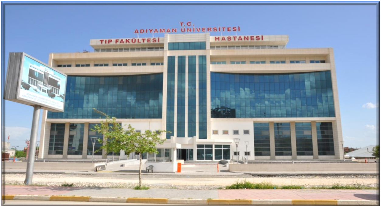
Tıp Fakültesi Hastanesi (1. Etap)

Hastane inşaatının birinci etabı tamamlanmıştır.