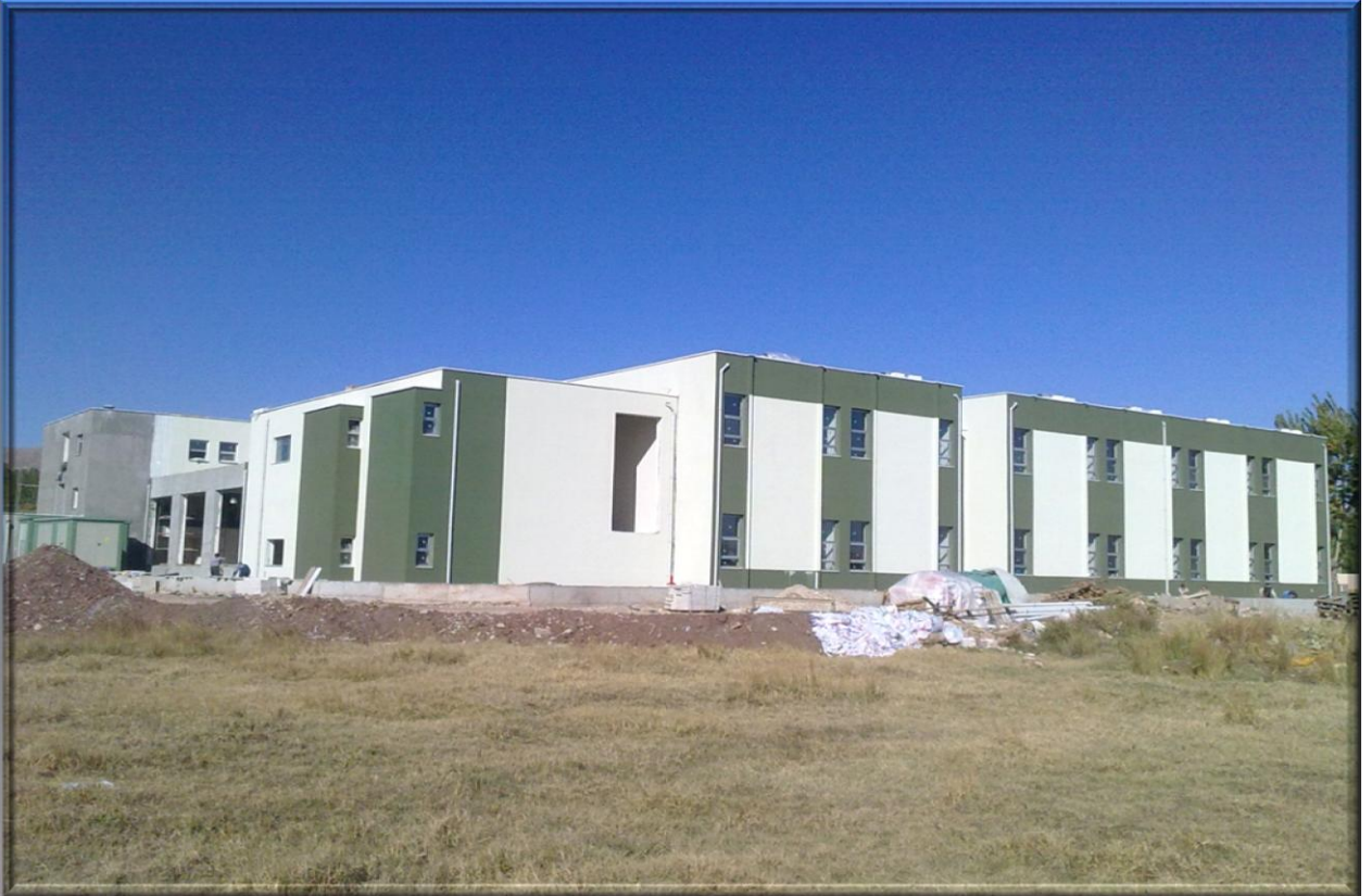
Gölbaşı Meslek Yüksekokulu Binası