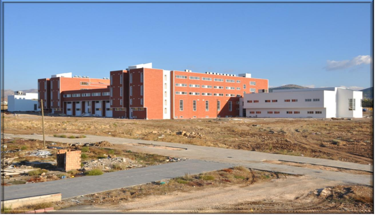
Fen Edebiyat Fakültesi Binası